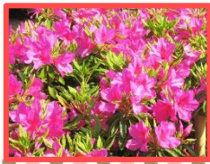
【ツツジ】4月中旬～5月上旬