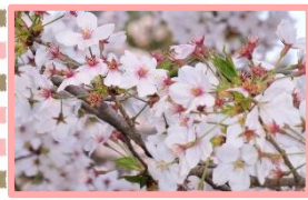
【サクラ】3月下旬～4月上旬