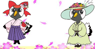
つるまちゃん ローゼちゃん