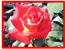
【バラ】5月中旬～6月上旬