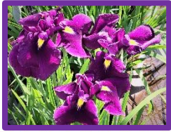
【ハナショウブ】5月下旬～6月上旬